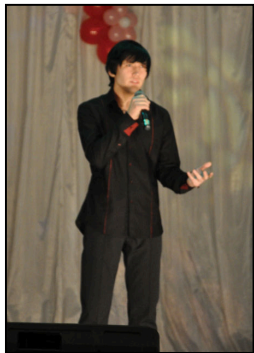
преподавателями и студентами учебных заведений области. Организаторами конкурса выступили ГБОУ СПО «Орский колледж искусств», ГАОУ СПО «Орский педаго-

29 ноября в ДК Нefтехимиков прошел II Открытый конкурс исполнителей песни на иностранном языке среди студентов СССУзов и ВУЗов Оренбургской области Singing World-2012, призванный не только создать условия для проявления творческого потенциала студенческой молодежи, но и стимулировать изучение иностранных языков, укрепить творческие связи между преподавателями и студентами учебных заведений области. Организаторами конкурса выступили ГБОУ СПО «Орский колледж искусств», ГАОУ СПО «Орский педаго-