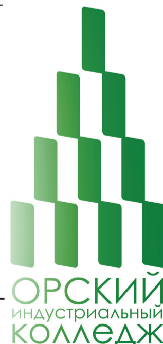
График работы приемной комиссии: понедельник – пятница с 9:00 до 16:30 Суббота с 9:00 до 13:00, Воскресенье – ВЫХОДНОЙ

г. Гай, ул. Молодежная, д.10, (35362)4-24-23.