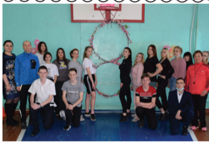
Автор: Барсукова И.

4 марта в спортивном зале ОИК прошла спортивная конкурсная программа «А ну-ка девушки!», посвященная празднику 8 марта. Организатором этого мероприятия выступила руководитель физического воспитания Барсукова И.Н., участие приняли 4 команды: 1 СУДа, 1 СУДб, 1 – ОДЛ, 1 – СВ. Звуки музыки, компетентное жюри – все создавало торжественную и праздничную атмосферу. После построения участники приступили к первому конкурсу «Визитная карточка» (юноши читали красивые стихи девушкам). И это было только начало! В нескольких конкурсах юным красавицам предстояло показать свою смекалку, хозяйственность, ловкость и быстроту. За всем следило строгое, но справедливое жюри. Все команды подошли к каждому из этапов со всей ответственностью и были достойно оценены в итоге. 1 место – группа 1 СУДа, 2 – место группа 1 СУДб, 3 место – группа 1 СВ, 4 место – группа 1 ОДЛ. И каким бы не был результат, мы еще раз убедились в том, что в нашем колледже учатся самые лучшие девочки! Праздник оставил самые приятные впечатления и целую бурю позитивных эмоций.